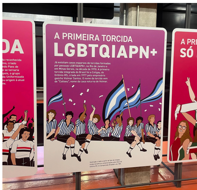
Figura 4 – Museu do Futebol, “A primeira torcida LGBTQIAPN+”