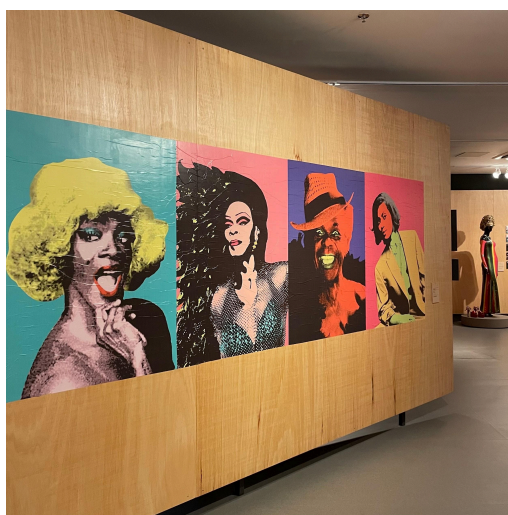
Figura 3 – MDS: obra “Série UóHol (2020)” de Rafa Bqueer