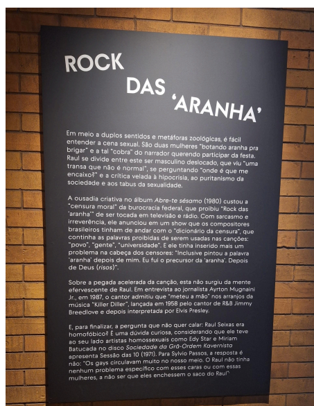
Figura 1 – Painel expográfico da sala Rock das ‘aranha’

Na sala chamada Rock das ‘aranha’, música muito polêmica, por trazer um duplo sentido — onde Raul fala de relações sexuais homoafetivas — no texto que abre a exposição havia um questionamento explícito sobre questões de homofobia e censura, utilizando a trajetória e a obra do cantor como ponto de partida para uma reflexão mais ampla. O trecho em questão: “E, para finalizar, a pergunta que não quer calar: Raul Seixas era homofóbico?” (Figura 1).