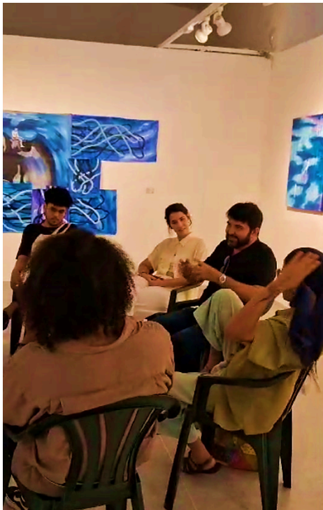
Figura 04 – Imersão do grupo de artistas da Residência (R)Existo 2024 na exposição individual ‘Em nome do Pai’, do artista Robson Xavier, na Usina Energisa, João Pessoa, PB, junho, 2024.