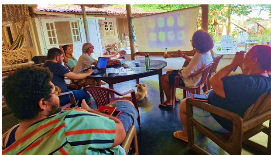
Figura 06 – Imersão do grupo da Residência (R)Existo da UFPB na Arapuca Arte e Cultura em outubro de 2024.

sendo uma luta conjunta e contínua. “conformando-se em meio a afecções e afetos dos corpos dissidentes, a teoria queer só pode se imaginar em processo de decolonização permanente.” (Pereira, 2015, p. 3). Para o fim da Residência, em outubro de 2024, desenvolvemos uma experiência imersiva em Arapuca Arte e Cultura que é um residência parceira de nosso projeto visando finalizar o ciclo e ter mais um espaço propício para a criação artística e poética (figuras 06 e 07).