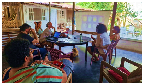
Figura 07 – Imersão do grupo da Residência (R)Existo da UFPB na Arapuca Arte e Cultura em outubro de 2024.

3) Produzir e divulgar uma exposição de arte contemporânea com jovens artistas nordestinos: Ao decorrer dos encontros havia sempre proposta de produção guiada, que ao passar das reuniões eram compartilhados com o grupo, atividades multimídias com abertura para experimentações. No mês de julho trabalhamos em conjunto em uma proposta de exposição coletiva ‘(R)Existo!’ submetido ao edital multiáreas da FUNJOPE (Fundação de Cultura de João Pessoa) com uma visão mais ampla do projeto. Mas já no fim do mês de agosto iremos entrar em pré-produção de uma mostra coletiva dos trabalhos desenvolvidos durante a residência.